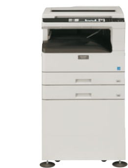
Základní jednotka (MX-M182D) Kryt dokumentů Kazeta na 250 listů Stolek pro 2 kazety