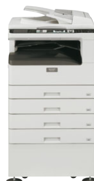
Základní jednotka (MX-M232D) Oboustranný obracíací podavač RSPF Separační rošt Dvojice kazet na 250 listů Stolek pro 4 kazety

Poznámka: MX-M182D může používat současně AR-D36 a AR-D37.