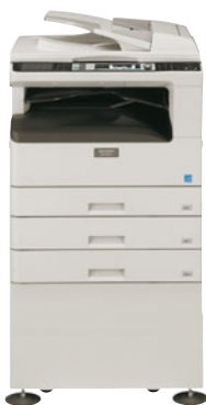
Základní jednotka (MX-M202D) Jednostranný podavač SPF Separační rošt Kazeta na 250 listů Stolek pro 3 kazety